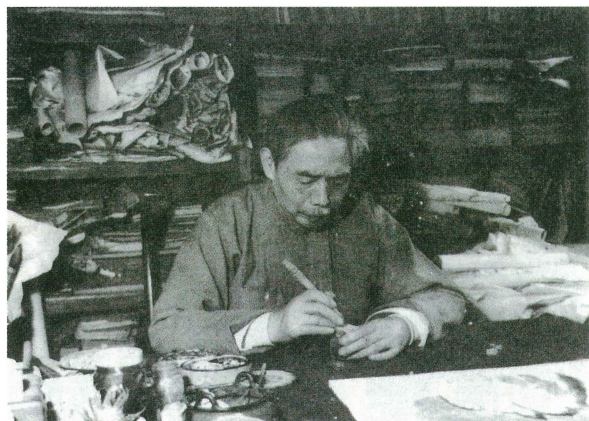
図2-2 銭瘦鉄（銭大礼編『銭瘦鉄印存』より）

これを手掛かりにその他印影を調べると、残り二〇顆のうち八顆が、近年編まれた『銭瘦鉄印存』に確認できることが判明した 2) 。あとの一二顆についてもその字形や風情は『銭瘦鉄印存』中のそれと異なるものではなく、ここから二一顆の印影は全て瘦鉄の刻印と判断でき、用箋はいわば瘦鉄刻印譜と呼びうる仕上がりとなっている。