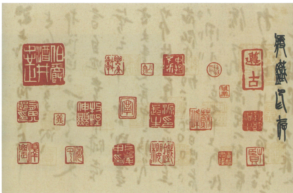
図1 印影散用箋 (後藤是山記念館蔵、ふー317)

一、後藤是山宛書翰に用いられた蘇峰の印影散用箋について 熊本市後藤是山記念館には、蘇峰からは山に宛てた一定数の書翰が収蔵されており、それらに用いられた書翰箋は多岐にわたる。中でも、昭和十二年(一九二七)四月五日の日付を有する書翰(ふー317)に使用された便箋は一段独特で、背景に二二顆の印影をあしらった、趣向を凝らした逸品である。